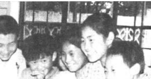
垦利县永安镇中学在日常教学管理中，念活“定、查、挂”四字经，有效地调动了广大教师的工作积极性，推动了素质教育的深入开展，为全面提高教学质量打下了坚实的基础。

“转”就是帮助教师转变教学观念。该校采取了请进来走出去的办法，与教学先进学校加强联系，聘请名师来讲课；同时，选派部分教师外出取经，学习外校先进的教学观念。“定”就是制定严格的管理措施。该校结合实际制定了《教学工作考评细则》和《教学工作目标及奖惩办法》等制度，分学科制定了《课堂教学评估标准》。“查”就是加强对教学常规的定期检查。该校对教学常规实行“周检查、月问卷、学期考核”制度。每周坚持两次教案检查，每月搞一次教师教学情况问卷调查。“挂”就是把教师常规落实及教研成绩和业务考核、评优选模、评聘晋级、奖励工资直接挂钩。(冯新生)