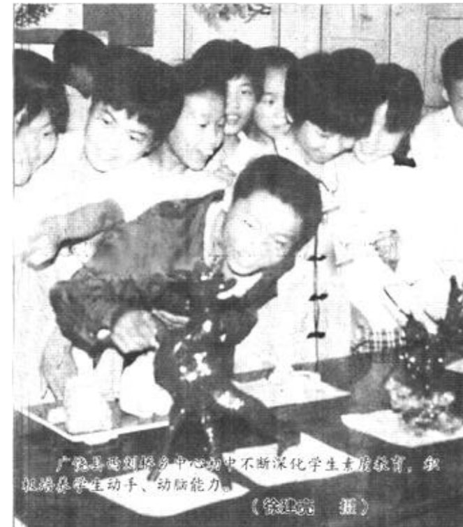
广饶县实验小学中心校不断深化学生素质教育，积极开展学生动手、动脑能力。