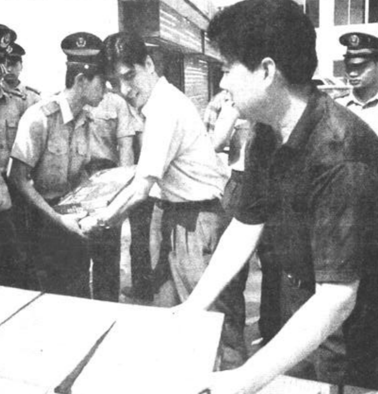
南京供电局员工近日来到武警南京市支队机关,向高温坚守在执勤第一线的武警官兵表示亲切慰问。